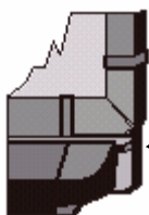
Controlelampje aan de rechterkant van de pennenbak

Het controlelampje geeft de status aan van uw interactief whiteboard. Afhankelijk van het model SMART Board interactief whiteboard dat u gebruikt bevindt het controlelampje zich aan de rechterkant van de pennenbak of rechtsonder aan de zijkant van het bord.