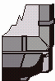
Controlelampje op de rechterzijde van de pennenbak

Het controlelampje geeft de status van uw interactieve whiteboard weer. Afhankelijk van het model van het SMART Board interactieve whiteboard dat u gebruikt bevindt het controlelampje zich rechts van de pennenbak ofwel rechtsonder op het frame van het bord.